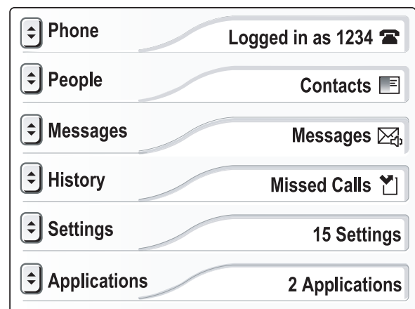
Mitel 5235 IP Phone – Menu de Descrição Geral

O menu de descrição geral do 5235 IP Phone apresenta o estado das comunicações e permite aceder a várias definições de telefonia e funcionalidades de aplicações. Este menu proporciona uma experiência consistente ao utilizador, com base na galardoadada aplicação de ambiente de trabalho Mitel Your Assistant™.